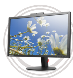
ThinkVision® T Serie Multimedia, ganze Serie