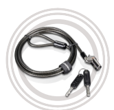
Lenovo™ Kensington® MicroSaver® DS Kabel- verriegelung Wirksamer, unkomplizierter Diebstahlschutz