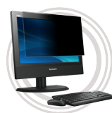
3M Blickschutzfilter Blickschutz und AntiGlare