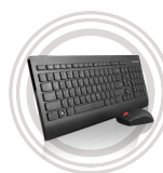
Lenovo™ Ultraflache kabellose Tastatur- und Mauskombination Präzise und komfortabel